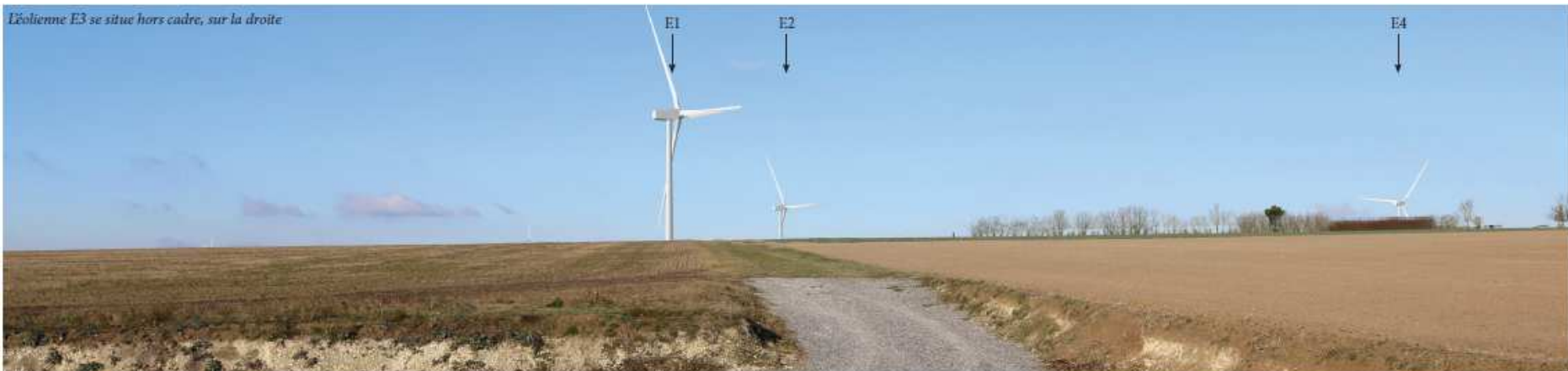
Lieu : Photomontage depuis les abords de la ferme isolée de Scay