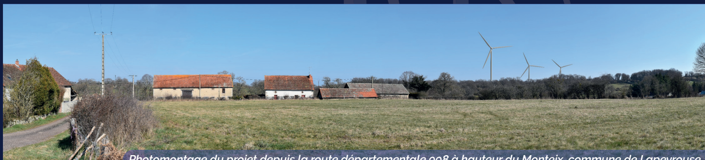
Photomontage du projet depuis la route départementale 998 à hauteur du Monteix, commune de Lapeyrouse.